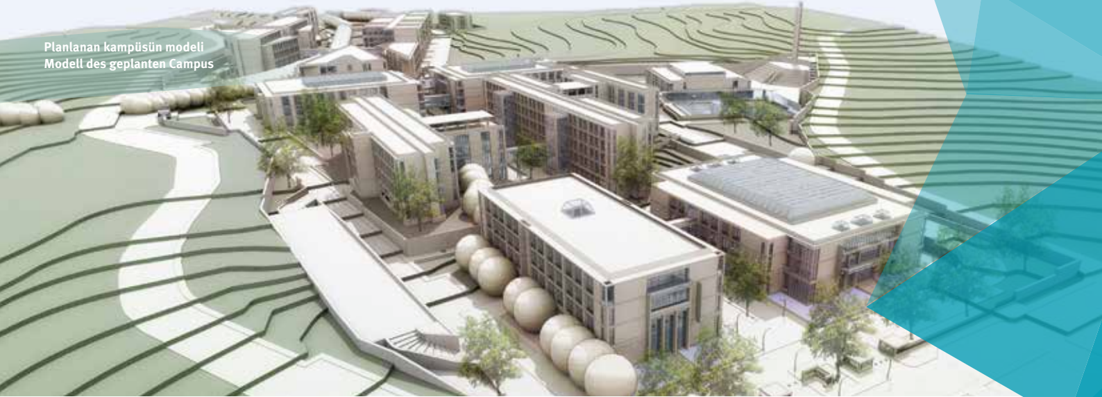
Planlanan kampüsün modeli Modell des geplanten Campus