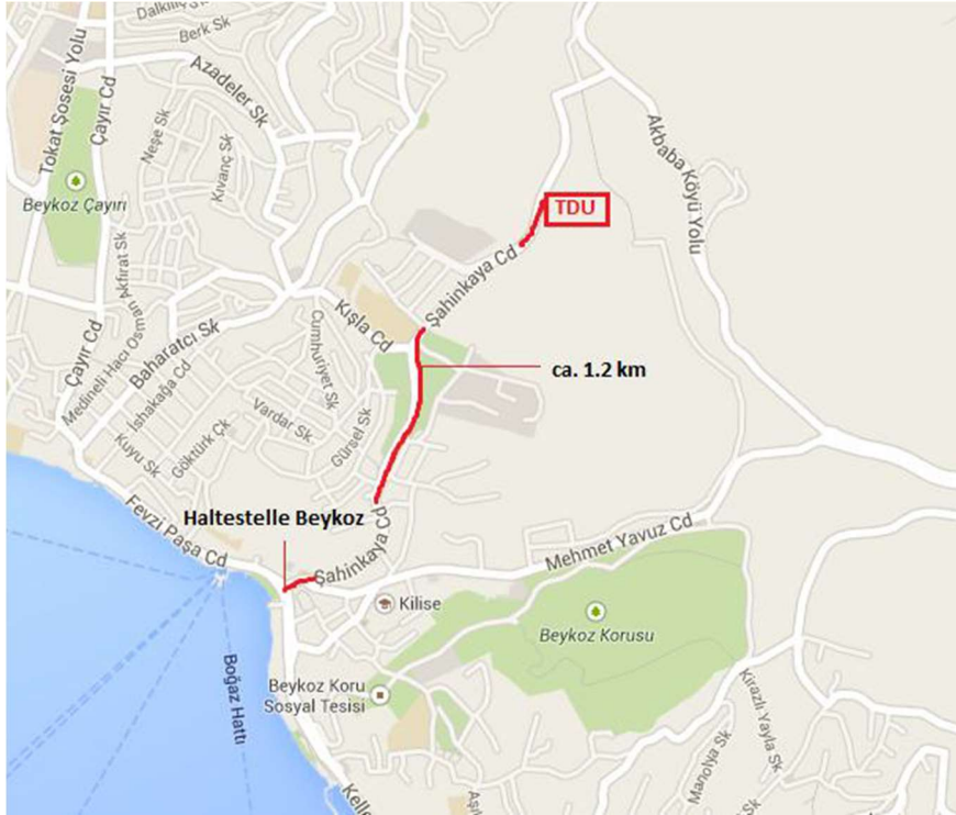
Karte 3 Beykoz -TDU